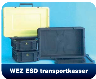
WEZ ESD transportkasser

Vores handelsafdeling kan tilbyde alt til ESD beskyttelse lige fra komponenttæsker til en komplet værkstedsindretning, og vores mange års erfaring har givet os den rigtige know-how til at vejlede vore kunder i løsningen af ESD-relaterede problemer. WALBOM A/S er UL-godkendt 3M converter, hvilket gør, at vi kan opskære tapes i præcis de bredder vore kunder ønsker.