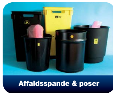
Affaldsspande & poser

Heel-straps med 1 MΩ modstand tilbydes som engangsstraps eller til permanent brug. Derudover kan vi også tilbyde ESD-skoovertræk med indbygget modstand, som sammen med engangsstraps ene anbefales til gæster.