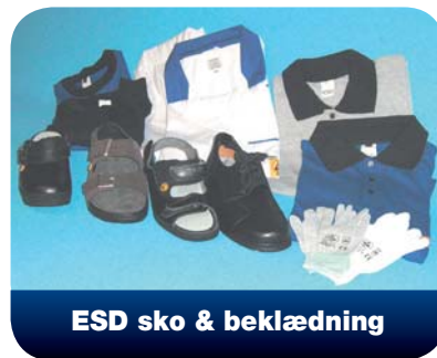
ESD sko & beklædning

Testapparater til test af både håndledsbånd og fodtøj. Apparaterne er til vægmontage, og skal placeres umiddelbart inden man træder ind i et ESD-beskyttet område. Korrekt funktion indikeres med grønt LED og med rød LED, når modstanden er udenfor det tilladte.