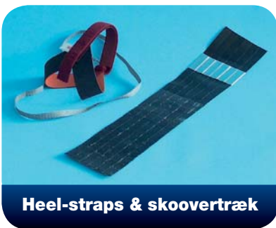
Heel-straps & skoovertræk

Heel-straps med 1 MΩ modstand tilbydes som engangsstraps eller til permanent brug. Derudover kan vi også tilbyde ESD-skoovertræk med indbygget modstand, som sammen med engangsstraps ene anbefales til gæster.