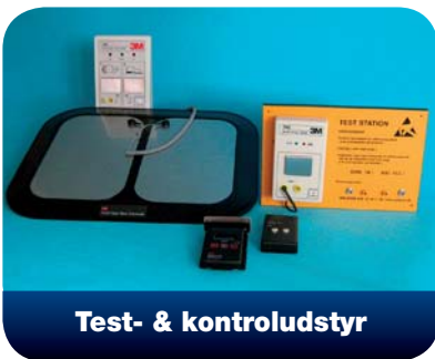
Test- & kontroludstyr

Vi har et stort udvalg af alle former for ESD emballage og tilbehør, så hvad enten behovet er anti-statiske poser, shielding poser, dry-shield poser eller tilbehør, såsom etiketter, tørremiddel eller fugtindikatorer eller diverse ESD-sikre forsendelseskasser er vi leveringsdygtige.